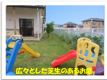
広々とした芝生のあるお庭