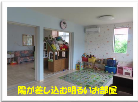
陽が差し込む明るいお部屋

家庭的な雰囲気の中、内閣府の厳しい指導基準を満たす安心安全な保育園です。 週1日からお預かりできます。見学、随時受付ます。